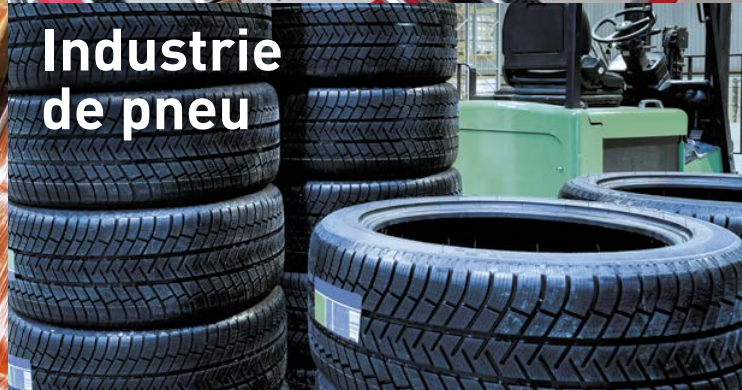
Industrie de pneu