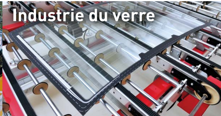
Industrie du verre