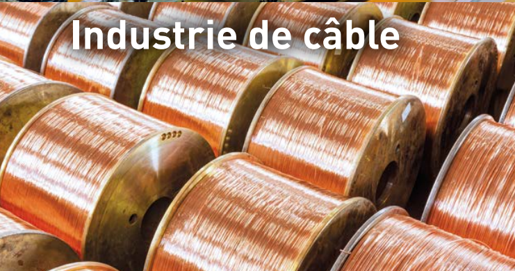
Industrie de câble